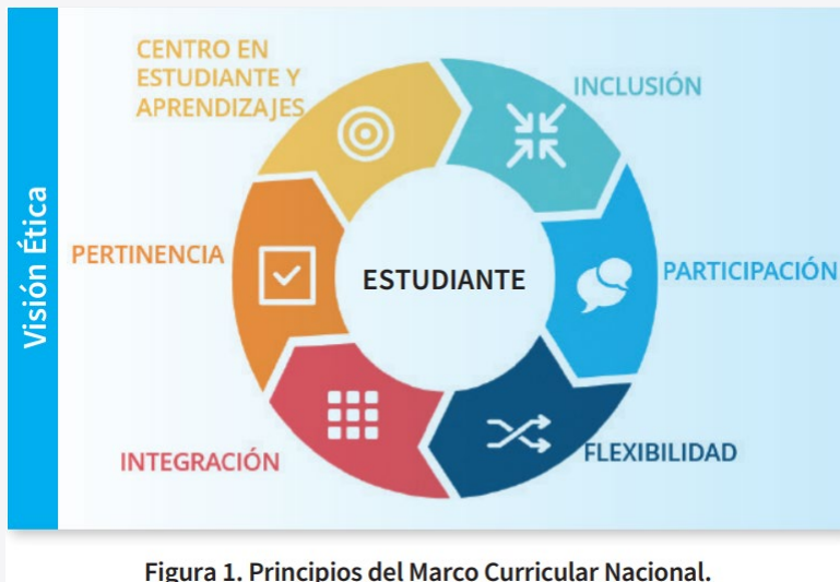
Figura 1. Principios del Marco Curricular Nacional.

Ente autónomo que regula la planificación, gestión y administración del sistema educativo en todo el territorio nacional.