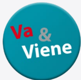
Va & Viene Derechos y Economía