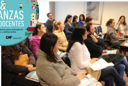
Programa de Capacitación Docente