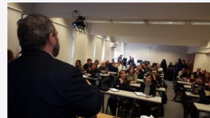
Curso de Economía para periodistas y sindicalistas