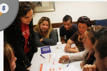
Talleres de Educación Económica y Financiera para Trabajadores y Familias