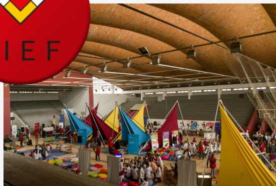
Feria Interactiva de Economía y Finanzas